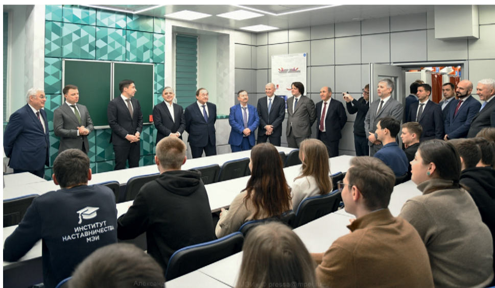
Встреча со студентами МЭИ