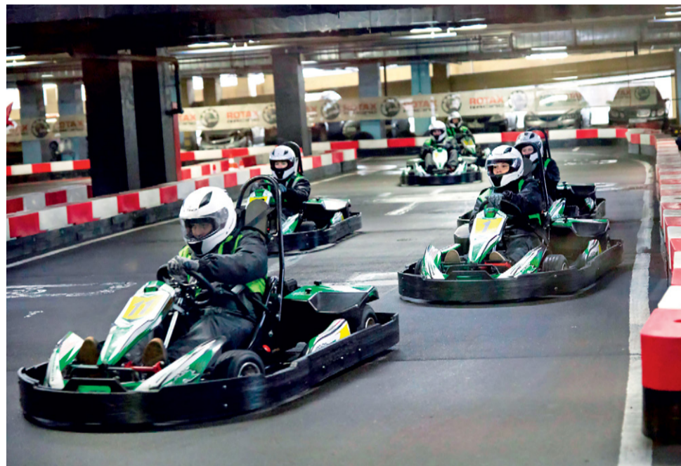
Победители определялись по лучшему времени прохождения одного круга

сладости, грамоты и медали, а взрослым достались уникальные походные наборы в форме канистр для бензина и подарочные сертификаты.