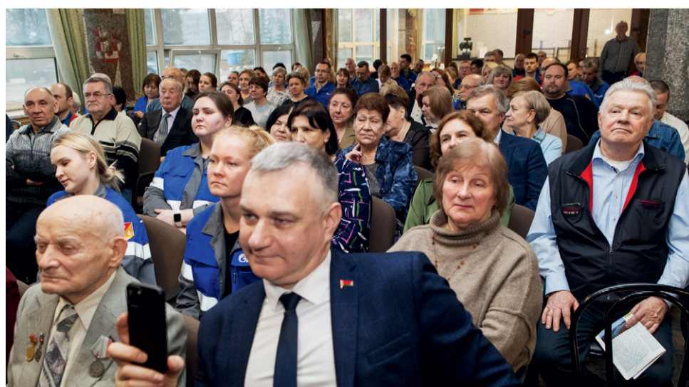
Мероприятие объединило ветеранов и молодежь ТЭЦ-25, а также почетных гостей