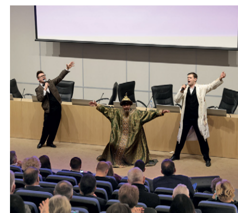
Выступление артистов Театра сатиры

артисты которого исполнили хорошо знакомые всем песни, подарив присутствующим настоящее новогоднее настроение.