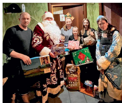
Детям Донецка и Луганска вручили подарки от Мосэнерго

Совет молодых специалистов не собирается останавливаться на достигнутом и уже готовит новую акцию для воспитанников детских домов. 📌