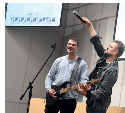
Сыграть на гитаре, не имея опыта? Легко, если рядом Александр Пушной!

Александр сразу же расположил к себе аудиторию, которая постоянно взрывалась хохотом и аплодисментами. Он рассказал о своем детстве в новосибирском Академгородке, учебе на физическом факультете НГУ и переезде в Москву, где он живет уже четверть века. Нашим кол-