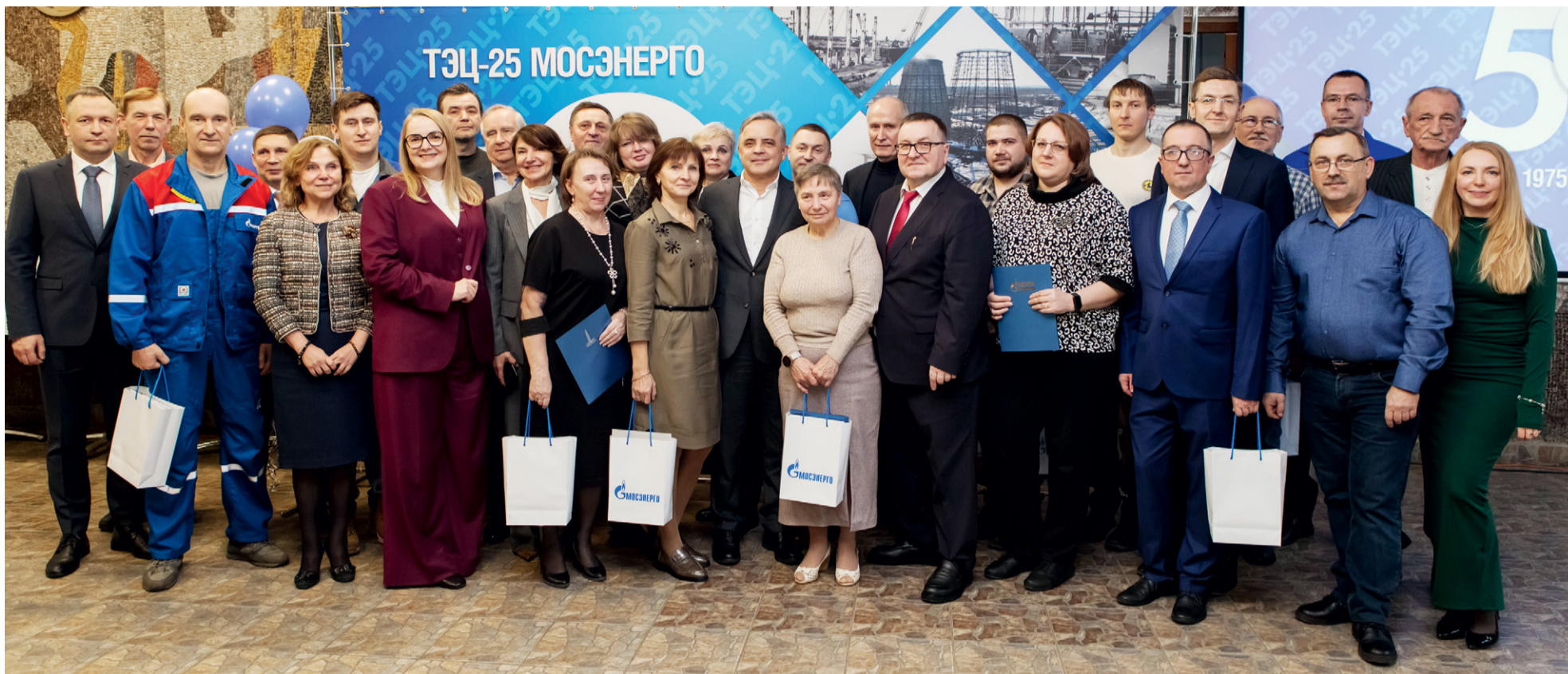
Руководство Мосэнерго, ТЭЦ-25 и сотрудники филиала, отмеченные благодарностями, почетными грамотами и званиями