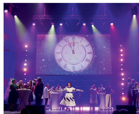
Артистам Мосэнерго удалось воссоздать атмосферу «Голубого огонька»