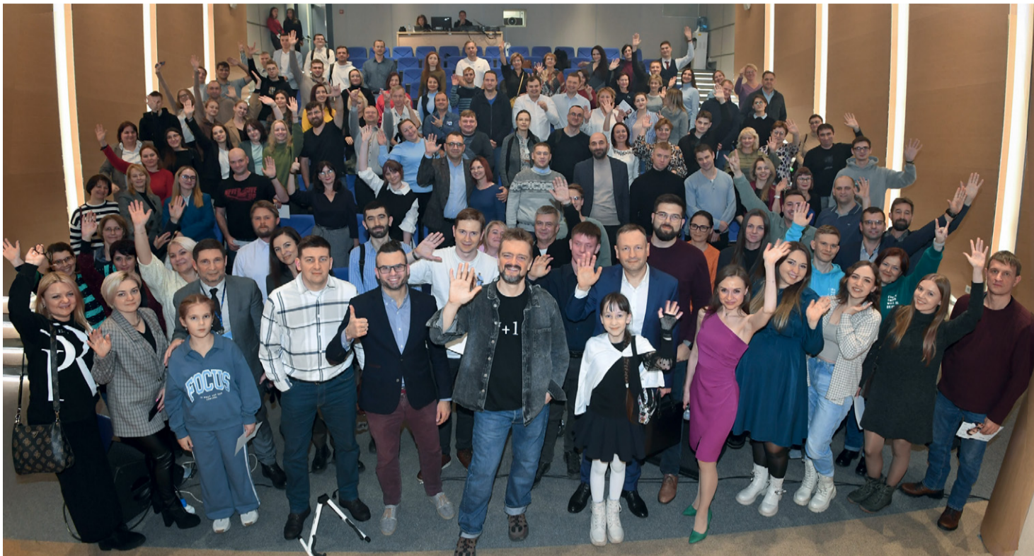
Встреча подарила всем участникам хорошее настроение и позитивные эмоции