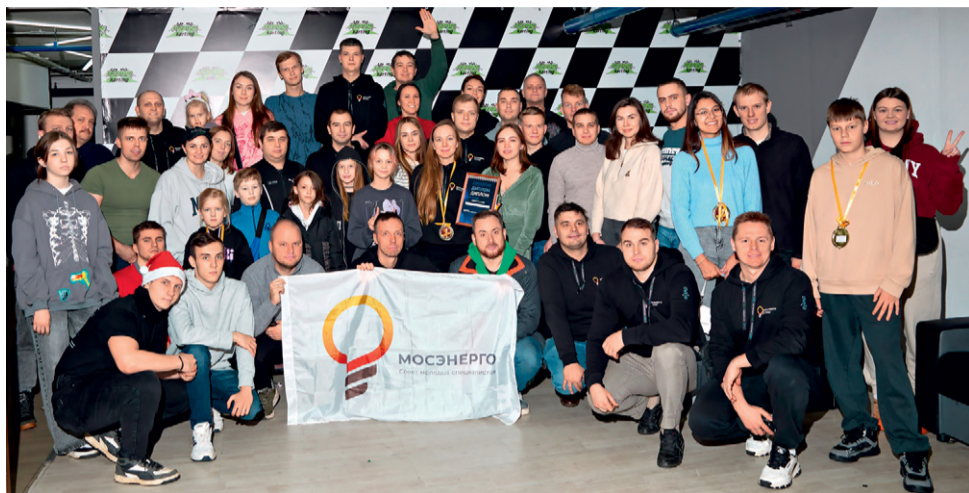
Мероприятие объединило взрослых и детей