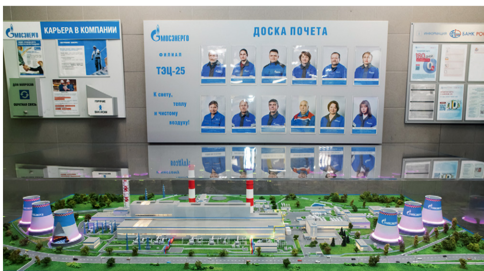
Интерактивный макет ТЭЦ-25, изготовленный специально к ее юбилею

В рамках мероприятия прошла церемония награждения работников станции, отмеченных благодарностями Мэра Москвы, ПАО «Газпром», ООО «Газпром энергохолдинг», почетными грамотами, званиями «Заслуженный работник», «Почетный работник», «Ветеран труда» ПАО «Мосэнерго».