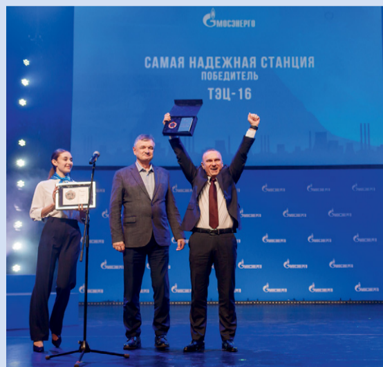
ГЭС-1 им. П. Г. Смидовича и ТЭЦ-16 получили награды в двух номинациях