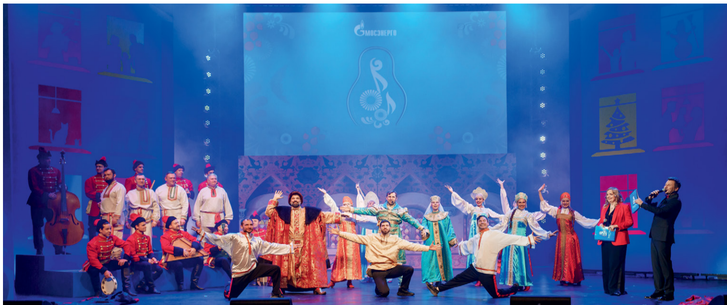
Творческий номер под песню «Разговор со счастьем» из кинокомедии «Иван Васильевич меняет профессию»